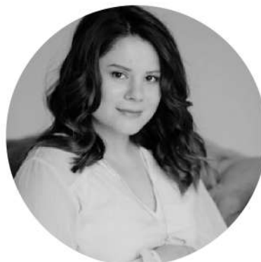
Юлія Ресенчук Президентка